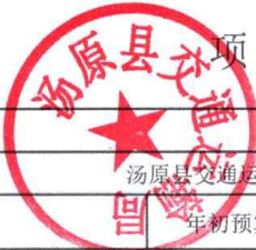
项目支出绩效自评表 (2024年度)